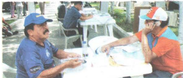
DEMOCRACIA. La soleada mañana guayaquileña acompañó a los simpatizantes del MPD.

La renovación de la directiva, según indicó Villacís, "es importante porque consolida la organización del partido y proyecta el crecimiento de nuestras bases. Hay filas de personas que están afiliándose hoy día (ayer), eso nos indica que vamos a salir muy fortalecidos de este proceso".