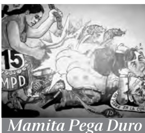
Por Maestro Po